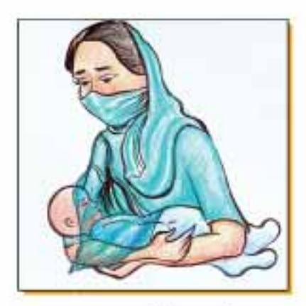
ياريج كومال كادود ومسلسل بإات رويل-