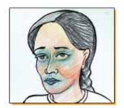
مونؤل اور چرے كا نيلا مونا

جب دوماوے کم عمر کا بچیخوراک لینا بند کردے تواہے محت کے مرکز یا میٹال ضرور لے جائیں۔ اگر آپ کی ایسے علاقے بیش دیجے ہیں جہال لیر یاعام ہے تو بخار ہونے کی صورت بیش محت کے مرکز یا میٹال ضرور جا کیں۔