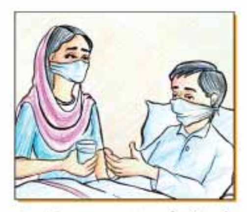
اگر مریض کو بہت کم پیشاب آرہا ہو یا پیشاب کارنگ گر اہواؤ اس کا مطلب ہے کہ مریض میں پانی کی کی واقع ہوگئی ہے اور آے پانی کی خرورت ہے۔ مریض کو گھر میں موجودہ صاف پانی یا ORS کے پیک پردرج ہایات کے مطابق کلول تیار کرکے بلا کیں۔